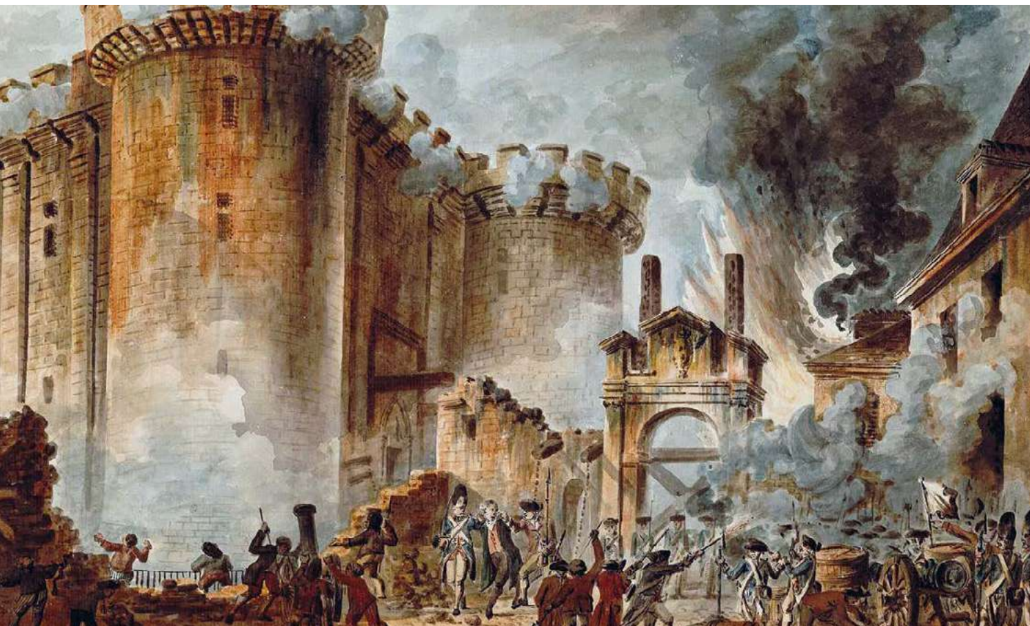
Prise de la Bastille le 14 juillet 1789 par Jean-Pierre Houël