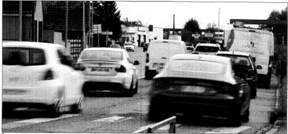
À la frontière des communes de Fegersheim et de Lipsheim, la RM83 est pour l'instant un couloir à voitures, avec bouchons, bruit et pollution en prime : l'objectif est d'en faire « une entrée apaisée et sécurisée » au sud de l'agglomération, avec plantation d'une « barrière végétale ».

végétalisée, à des abords arborés, à des trottoirs, à des cheminements cyclables. Des espaces verts sur l'ensemble du tronçon sont destinés à protéger un peu mieux les riverains, à contribuer à une réduction de la vitesse, donc de la pollution, affirme Béatrice Bulou, vice-présidente de l'Eurométropole en charge de la voirie et de l'aménagement de l'espace public.